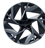
Jante aliaj 19", design esprit alpine (RALU19/RDIF1)