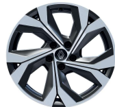
Jante aliaj 18" (RALU18/RDIF12)