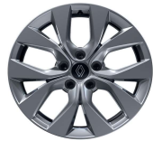
Jante aliaj 17" (RALU17/RDIF15)